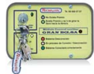
Diagrama Gran Bolsa

Gestiona el sistema sin que el personal del salón acceda al ordenador: encendido y apagado, validación de premios, y control de opciones de visualización TV.